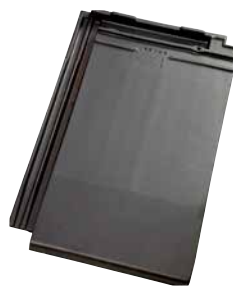
leikleur mat engobe